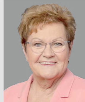
Monika Bachmann (CDU), Ministerin für Soziales, Gesundheit, Frauen und Familie des Saarlandes

Wir sind der Auffassung, dass auch Qualitätsvorgaben bei der Krankenhausplanung berücksichtigt werden sollen. Dafür müssen Doppelstrukturen und Überkapazitäten abgebaut und medizinische Schwerpunktzentren aufgebaut werden. So werden Patientinnen und Patienten künftig in derjenigen Klinik behandelt werden können, die bei Ausstattung, Ruti-